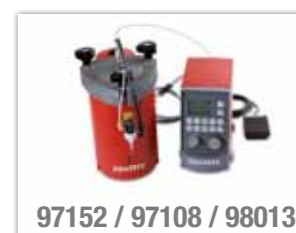
97152 / 97108 / 98013

Tento systém je vhodný pro nanášení kapek nebo housenek vteřinových lepidel LOCTITE s nízkou až střední viskozitou. Je určen k zabudování do automatizovaných montážních linek. Membránový ventil umožňuje provádět nastavení zdvihu v malých krocích a zajišťuje nanášení bez odkapávání. Řídicí jednotka ovládá ventil, zásobník a spouštění systému pomocí nožního spínače, tlačítkové klávesnice nebo nadřazené programovatelné řídicí jednotky.